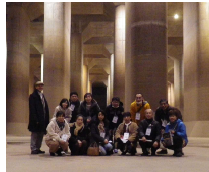
首都圏外郭放水路にて

令和2年1月28日(火)市P連会員を対象とした研修会が開催されました。 午前中は、日本で最大規模の宇宙航空開発施設である筑波宇宙センターを訪れ、「きぼう」運用管制室や宇宙飛行士養成エリアなどの見学を行いました。様々な発見や驚きがあったのですが、一番驚いたのは施設内のコンベアに行く際にも申請が必要な程のセキュリティの高さでした。 午後は、世界最大級の地下放水路である首都圏外郭放水路を訪れ、長さ177メートル・幅78メートル・高さ18メートルにおよぶ地下神殿のような巨大な水槽の見学を行いました。施設の稼働回数は多く、昨年関東地方に甚大な被害をもたらした台風19号の際にも稼働し、災害を未然に防いだことでした。