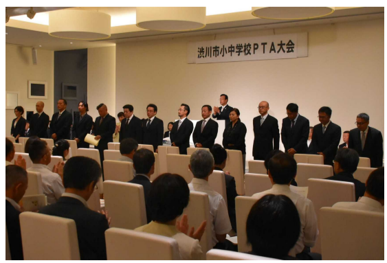
平成30年度 PTA 会長の皆様