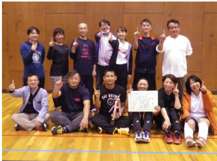
優勝した子持中学校の皆様

優勝 子持中PTA 準優勝 古巻小PTA 第3位 渋川西小PTA 決勝トーナメント進出 橋小PTA 伊香保小PTA 金島中PTA 渋川北小PTA 中郷小PTA 豊秋小PTA 古巻中PTA 渋川中PTA 渋川北小PTA 交流リーグ戦1位 小野上小PTA 橋北小PTA