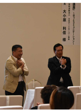
大小原先生と教育長